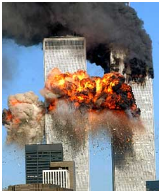
ANGREPET: Over 6000 mennesker er savnet etter terrorangrepet mot World Trade Center 11. september.